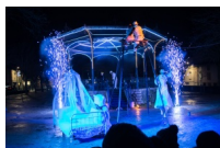
© Emilie Montarlot - LE FÊTE DE NEIGE