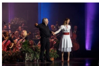
@Musique en fêtes