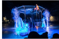
© Emilie Montarlot - LE RÊVE DE NEIGE