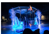
LE RÊVE DE NEIGE