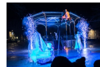
LE PÈRE DE NEIGE